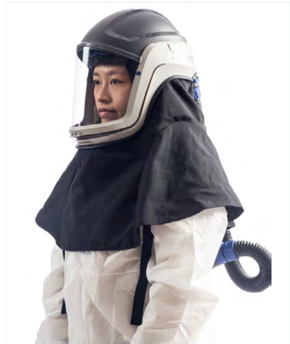
動力淨氣式呼吸防護具 ( PAPR · 頭盔 ) APF = 25/1,000*