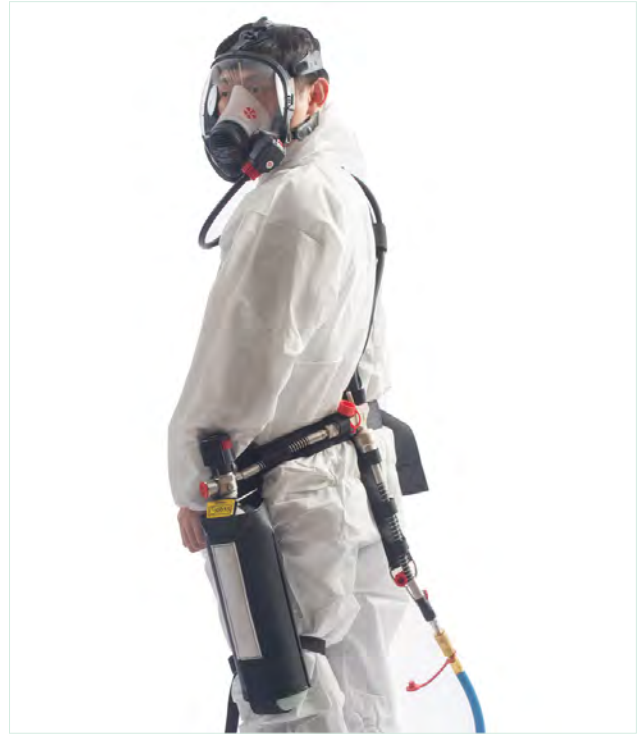
組合式全面體壓力需求型輸氣管式呼吸防護具搭配輔助自備空氣源