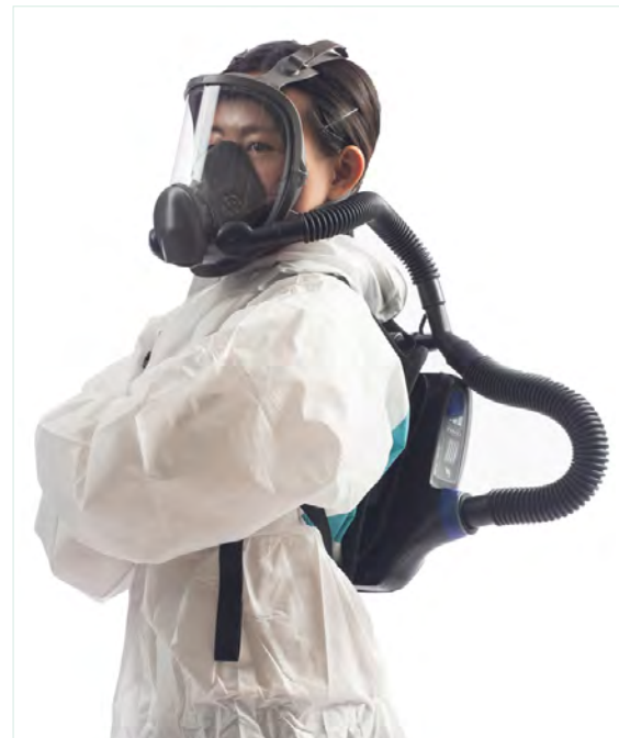
全面體動力淨氣式呼吸防護具 ( PAPR · 緊密貼合式 ) APF = 1,000