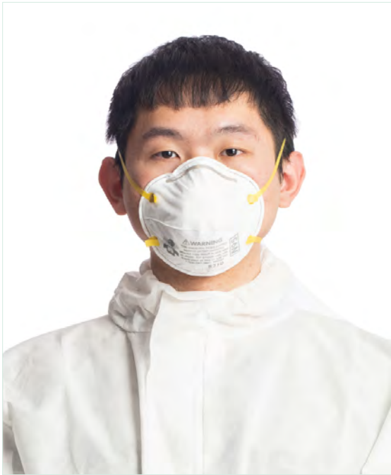
過濾面體式口罩 APF = 10