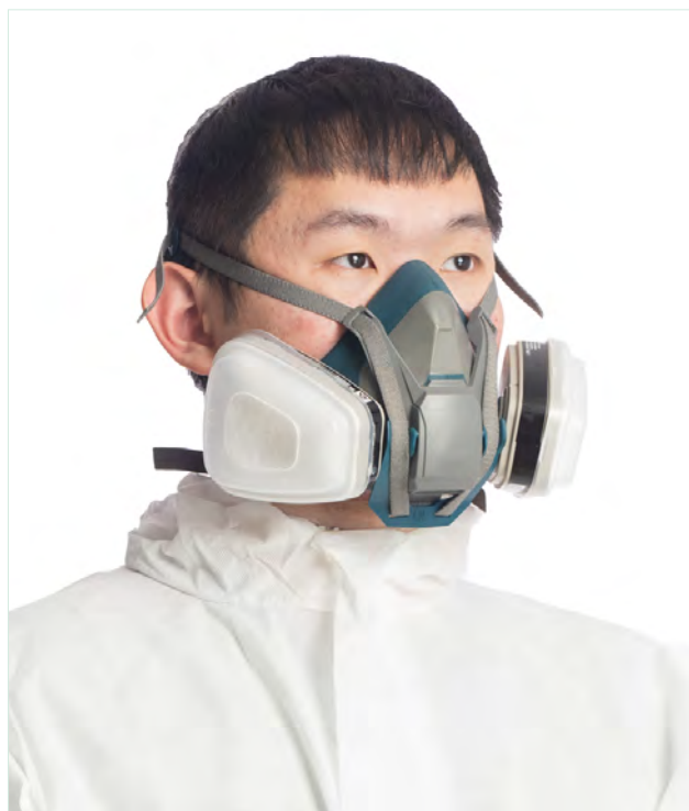
防塵面 (口) 罩 (面體與濾材分離)

考慮油霧滴負荷對濾材所造成的影響，美國將防塵濾材分為 N、P 與 R 三種，分別代表非抗油 (not resistant to oil)、抗油 (resistant to oil) 與耐油 (oil proof)，並依防護效果分為 95%、99% 與 100% 3 種等級，其中 N 級代表的是濾材不能使用於含有油氣的環境；R 級代表的是濾材具有 8 小時以內隔離油氣的能力 (使用一次，或者是連續或間斷使用 8 小時，但使用 8 小時的條件為不致使濾材過濾效率降低，或者是使微粒於濾材上的累積量超過 200 mg)；P 級代表的是可完全隔離油氣。