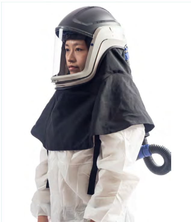
動力淨氣式呼吸防護具 (PAPR) 搭配頭盔

另應注意的是，動力淨氣式呼吸防護具 (PAPR) 及供氣式呼吸防護具 (SAR) 搭配頭盔或頭罩時，經過「作業現場防護係數」或「模擬作業現場防護係數」測試後，其指定防護係數可達 1,000，但若上述防護具組合沒有經過測試，則僅能以寬鬆式面體的標準視之，即指定防護係數等於 25。