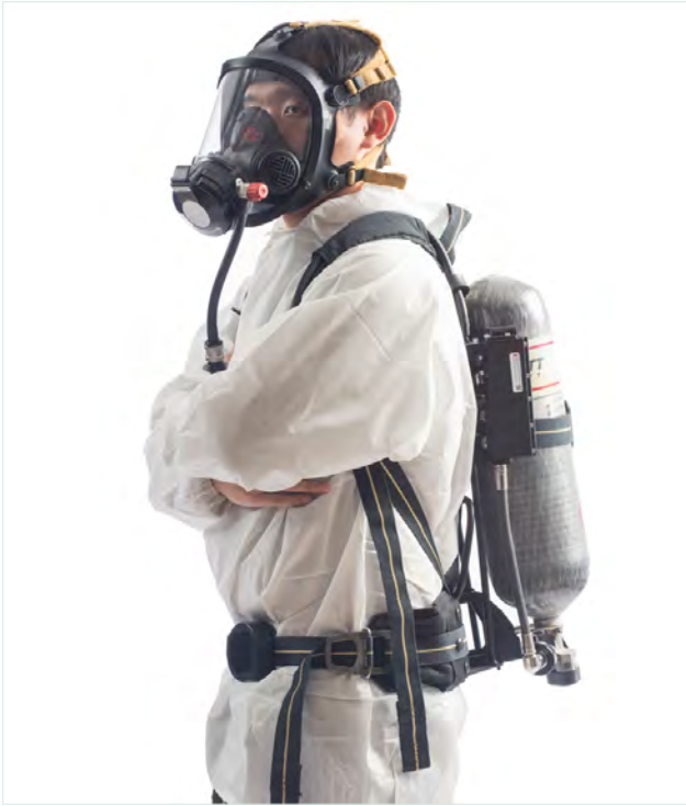
全面體壓力需求型自攜式呼吸防護具