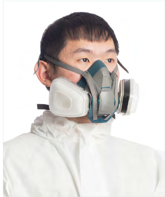
半面體呼吸防護具 APF = 10