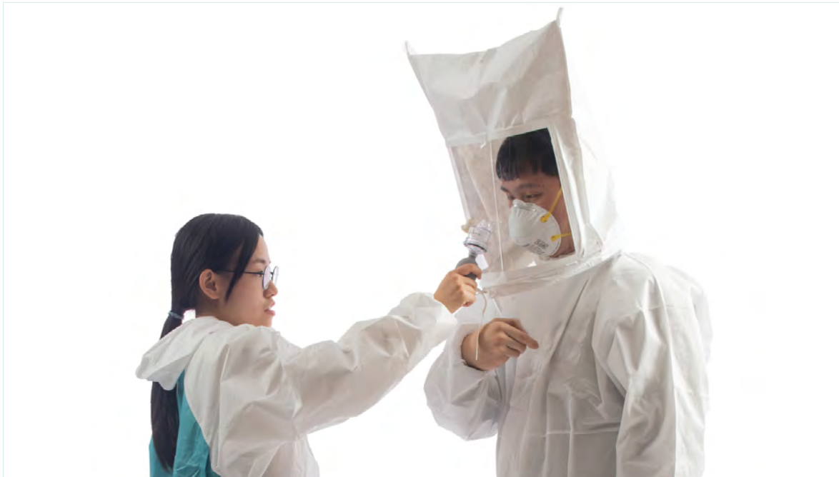
過濾面體式口罩之定性密合度測試

定性密合度測試是利用苦味劑、糖精、刺激性煙霧或香蕉油作為測試劑，由受測者嗅覺或味覺主觀判斷是否有測試氣體洩漏進入面體內。