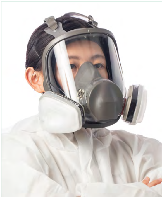
全面體呼吸防護具 APF = 50