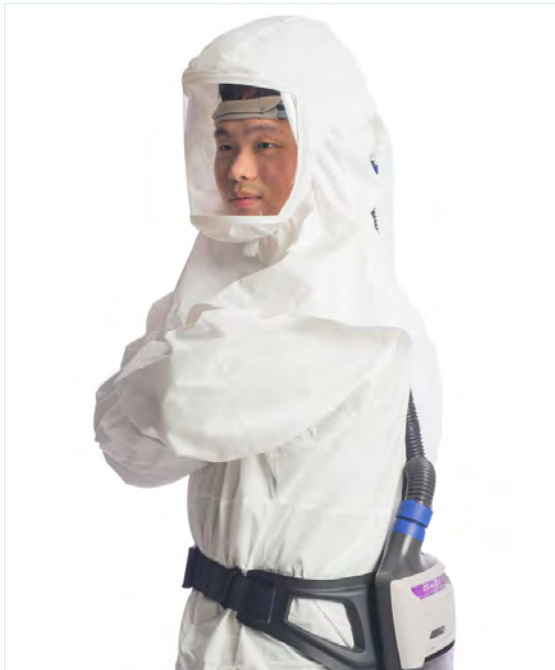
動力淨氣式呼吸防護具 ( PAPR · 寬鬆面體 ) APF = 25