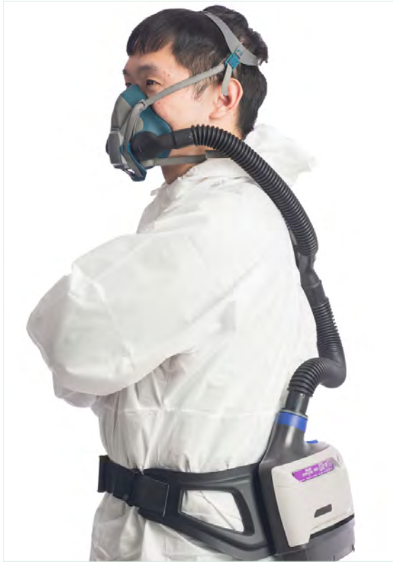
半面體動力淨氣式呼吸防護具 ( PAPR · 緊密貼合式 ) APF = 50