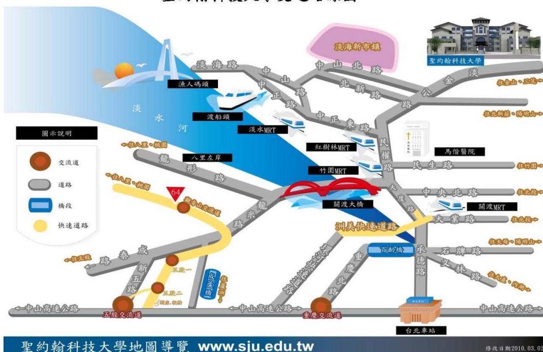
聖約翰科技大學交通路線圖